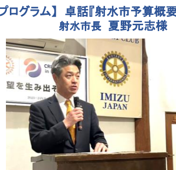
【本日のプログラム】卓話『射水市予算概要』 射水市長 夏野元志様