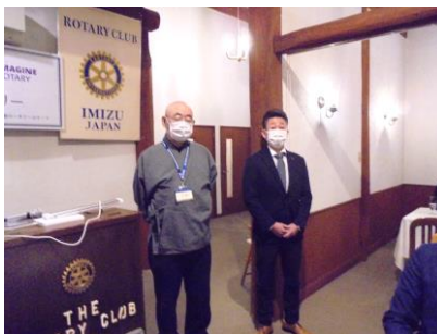
2月誕生日の上田会員と笹川会員