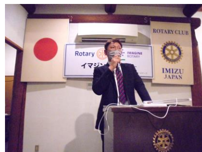
小谷会長エレクト