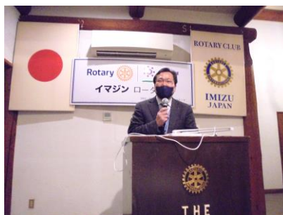
吉田地区青少年交換副委員長